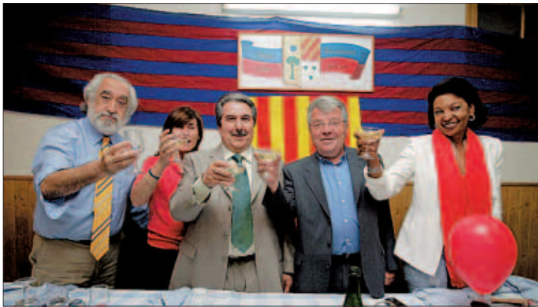
Brindis en la mesa presidencial por los éxitos del FC Barcelona en la presente temporada